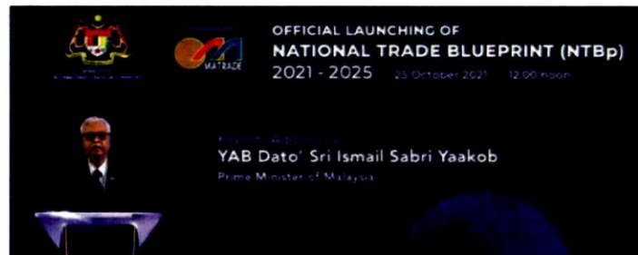
Ismail Sabri melancarkan Rangka Tindakan Perdagangan Nasional secara maya, semalam.

Rangka Tindakan Perdagangan Nasional yang digariskan kerajaan dan dilancarkan semalam akan meningkatkan daya saing perdagangan Malaysia dan mengukuhkan kedudukan negara sebagai pengeksport terunggul, demikian kata Perdana Menteri, Datuk Seri Ismail Sabri Yaakob. Beliau berkata, rangka tindakan itu menggariskan strategi dan inisiatif pembangunan lima tahun (2021-2025) dengan lapan teras strategik dan 40 cadangan bagi menyediakan peluang untuk memperkukuhkan kedudukan Malaysia di arena antarabangsa. Katanya, ia juga menangani perubahan struktur yang diperlukan untuk sektor eksport berkembang maju menerusi pengukuhan mudah cara perdagangan, logistik, pematuhan standard, akses pasaran, kemampunan, pen-