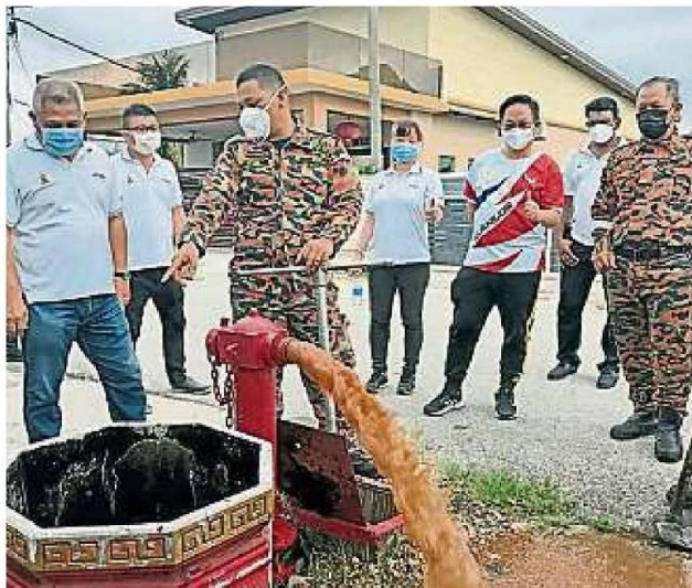
消防员检查消防栓是否处于良好的状态，包括有没面对水压问题。