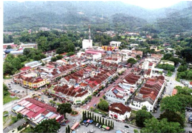
An aerial view of Kuala Kubu Baru, the municipal council's administrative centre.

Kuala Kubu Baru is the administrative centre for Hulu Selangor and was recognised as the First Planned City in Malaysia and First